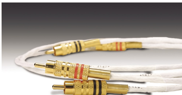
Chevel 'Ohr CAVO DI SEGNALE

Ciò che realmente conta in un cavo di segnale non sono i freddi numeri dei dati tecnici, ma le performance che esso offre. Trasparenza, dettaglio, velocità perché nulla deve interferire sul suono, sono le caratteristiche dei cavi 'Ohr e Navi, grazie al sapiente uso di materiali e componenti di primissima qualità, rispettose delle severissime norme militari per quanto riguarda Navi.